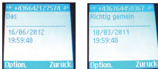
Abbildung 3: Visualisierung der beiden SMS mit einem handelsüblichen Handy